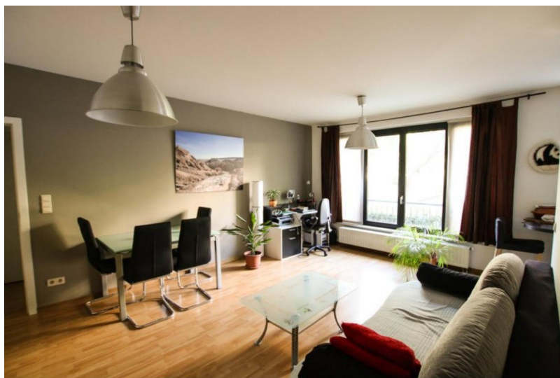
Ixelles (réf 2002 B) :

Proche des Institutions Européenne et dans un cadre verdoyant, magnifique appartement en excellent état situé rez-de-chaussée d'un immeuble de Standing construit en 2000 comprenant : un superbe salon lumineux de 22 m², cuisine super-équipée américaine, 1 chambre à coucher, sdb, wc sép, espace buanderie/chaufferie, cave. Ascenseur, chaudière individuelle au gaz. Actuellement loué. A voir !!! Emplacement de parking pour 25.000 euros.