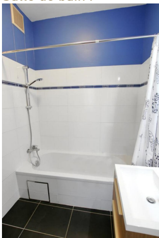
Salle de bain :