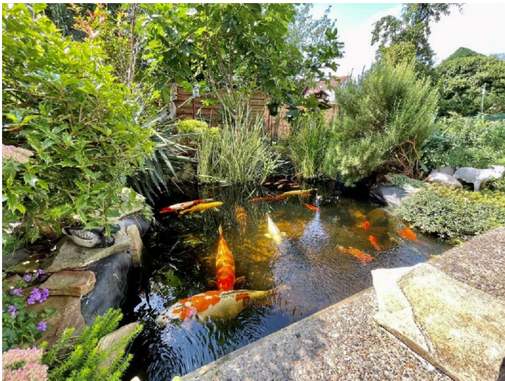
Ixelles (réf 2187 B)

Ixelles (réf 2187 B) à 2 min du quartier du cimetière d'Ixelles - IMMEUBLE TRES BIEN ENTRETENU – APPARTEMENT TRES BIEN ISOLE CAR TRES PEU DE CONSOMMATION DE CHAUFFAGE MENSUELLE ! Magnifique REZ DE CHAUSSEE avec jardin - très grande et spacieuse cuisine super équipée (électroménager NEF) avec îlot central donnant sur la salle à manger (cuisine + sàm : 8,78 \times 5,91 = 51,94 \text{ m}^2 ) - beau salon ( 5,18 \times 5,06 = 26,26 \text{ m}^2 ) - buanderie - wc séparé - belle et spacieuse salle de douche avec 2ème wc et bidet - 2 grandes chambres ( 24 \text{ m}^2 & 25 \text{ m}^2 ) - superbe jardin avec pièce d'eau orienté PLEIN SUD et très calme sans vis-à-vis ! Adoucisseur d'eau – (1 double emplacements de parking en enfilade ( 44 \text{ m}^2 ) pour 22.000€) - volets électriques à l'arrière. Chauffage central mazout (bientôt nouvelle chaudière GAZ à basse consommation !) A voir absolument... PEB = en cours. Electricité conforme jusqu'en 2037.