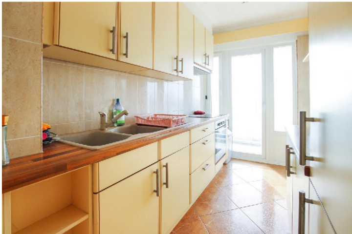
Cuisine équipée :

Avenue des Saisons, 42 à 1050 Ixelles 02/660.21.21