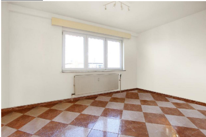
Hall de nuit :

Century 21 Boondael - GSM : 0479/43.33.95 - Site web : www.century21boondael.be