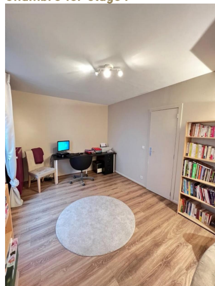
Chambre 1er étage :