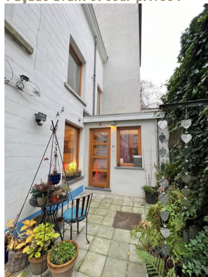
Façade avant et cour privée :