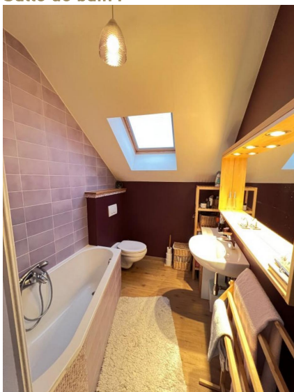
Salle de bain :