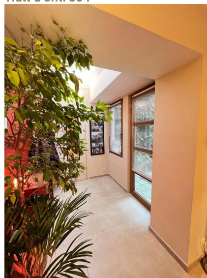
Hall d'entrée :