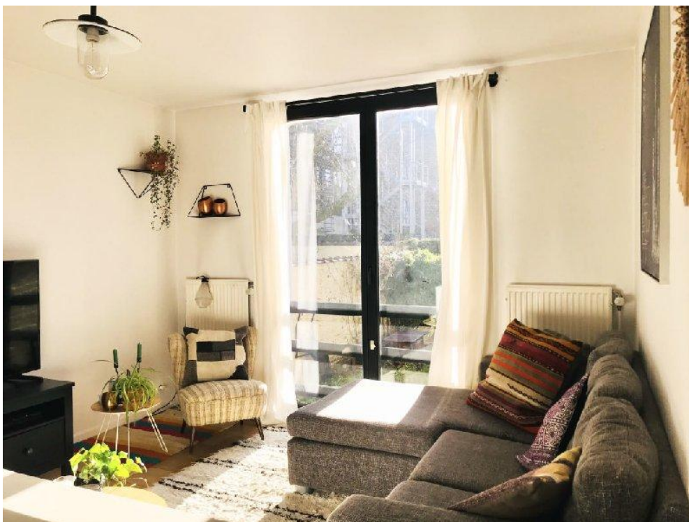
Ixelles (réf 2284 B) :

Situé dans le quartier du cimetière d'Ixelles, superbe appartement/duplex meublé de 2 chambres avec jardin et cour orienté SUD . L'appartement comprend de très nombreux rangements encastrés et a été rénové récemment. Petite copropriété SANS CHARGES COMMUNES ! Qu'attendez-vous pour visiter ?