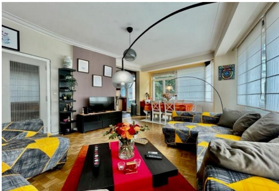
Ixelles (réf 2451 B) :

Magnifique appartement de 2 chambres loué meublé en très bon état général dans une copropriété bien entretenue (ascenseur aux normes) - parquet dans le salon - hall d'entrée - wc séparé - salle de bain - libre à partir du 20 juin 2023 - balcon.